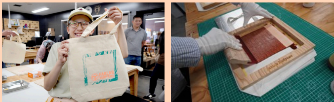
※今和7年度開催オリジナルトートバックづくりの様子

複数のシルクスクリーン版のデザインとインク色を選 び、無地のサコッシュに自分でインクをプリントして オリジナルサコッシュをつくります！